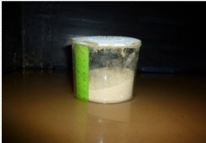
未対策マンホール

我々は \forall 複合型災害に対し多方面から被害予測, 及び対策を講じる必要がある。特に個人住宅や既設構造物に適用可能である効果的な対策工法についての研究は社会的関心, 及び重要度を増している。