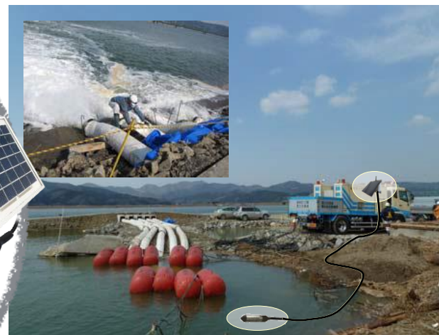
ポンプ車による排水